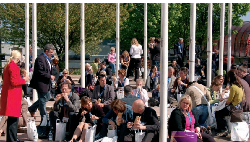
Lunsjen ble inntatt ute i solen.