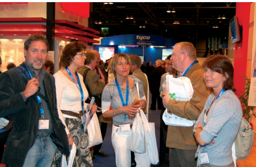
Danske og norske konferansedeltagere fant hverandre i utstillingslokalene.

Årets konferansemiddag var lagt til Science center, en form for teknisk museum. Dette ble egentlig en nedtur. Typisk nok hadde svært mange valgt alternative arrangementer denne kvelden, noe jeg forstår etter å ha deltatt. Vi stod oppvartet langs en murvegg og prøvde, etter beste evne, å balansere et rødvinsglass sammen med en skål med Haggish. Jeg har skjønt at det er slik vi gjør det nå til dags, men jeg kan ikke si at jeg fant det veldig hyggelig. Kveldens høydepunkt var dansen. Et skotsk orkester bestående av to trekkspill og trommer (!) spilte skotsk folkelig musikk. I tillegg fungerte en av trekkspillerne som danseinstruktør. Når jeg i tillegg møtte en gruppe skotske tissueviability sykepleiere som så det som en oppgave å lære denne nordmannen skotsk folkedans, så ble avslutningen OK. Jeg kan med en viss stolthet si at jeg fredags morgen var mer preget av gangsperr enn av bakrus. ■